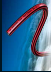
Wasserschläuche für industrielle und gewerbliche Einsätze